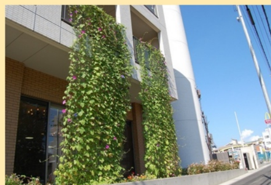
国道2号線沿いのグリーンカーテン

利用料金は負担額定額制（実費除く）なので、介護保険限度額超過を気にせずにサービスを利用することができます。