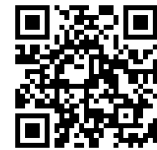
大久保苑紹介動画