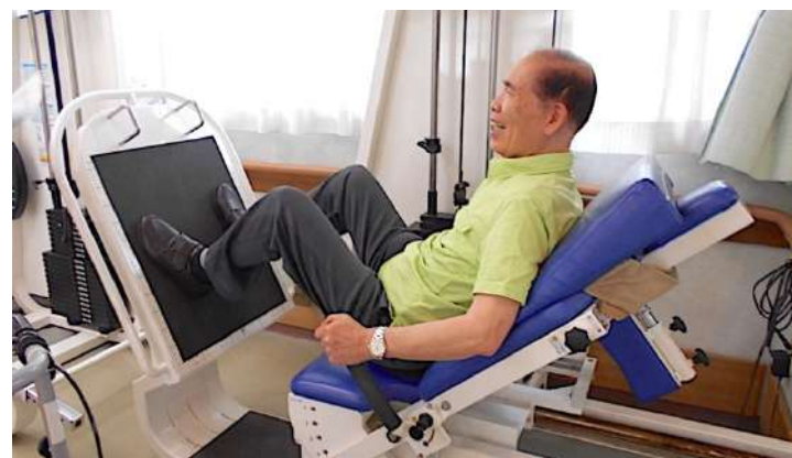
通所リハビリでは、3種類のパワーリハビリ機器を取り揃えトレーニングしています