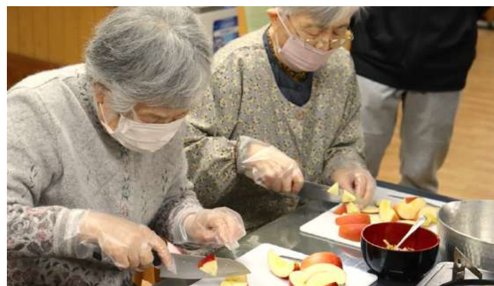
デイサービスでは、認知症進行予防を目的とした手作りクッキングに力を入れています