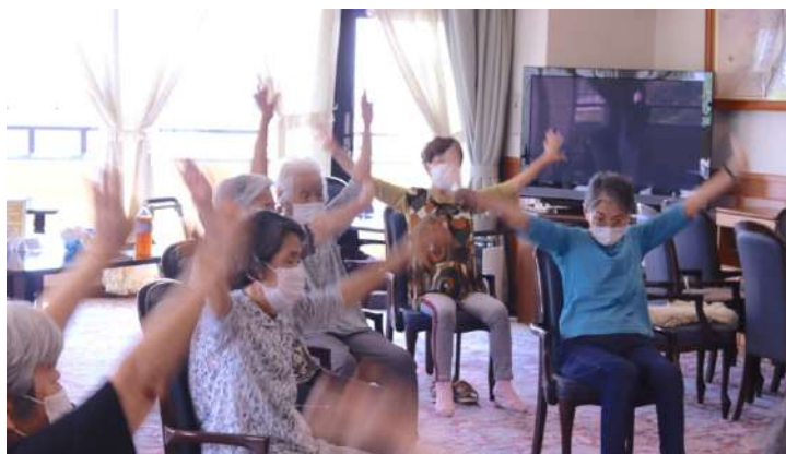
ケアハウスでは、入居者の健康維持増進を目的に健康教室を定期的に開催しています