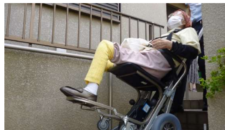
老健では、在宅復帰前にご自宅を専門職が訪問し自宅での生活をシミュレートします