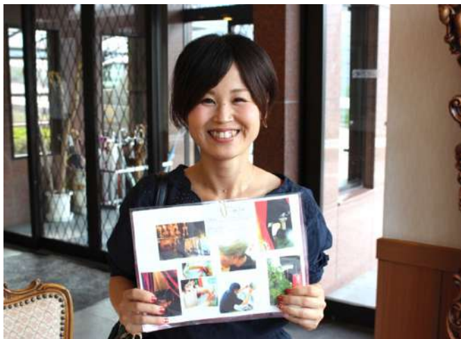
訪問で美容師さんに月2回来苑頂いています。