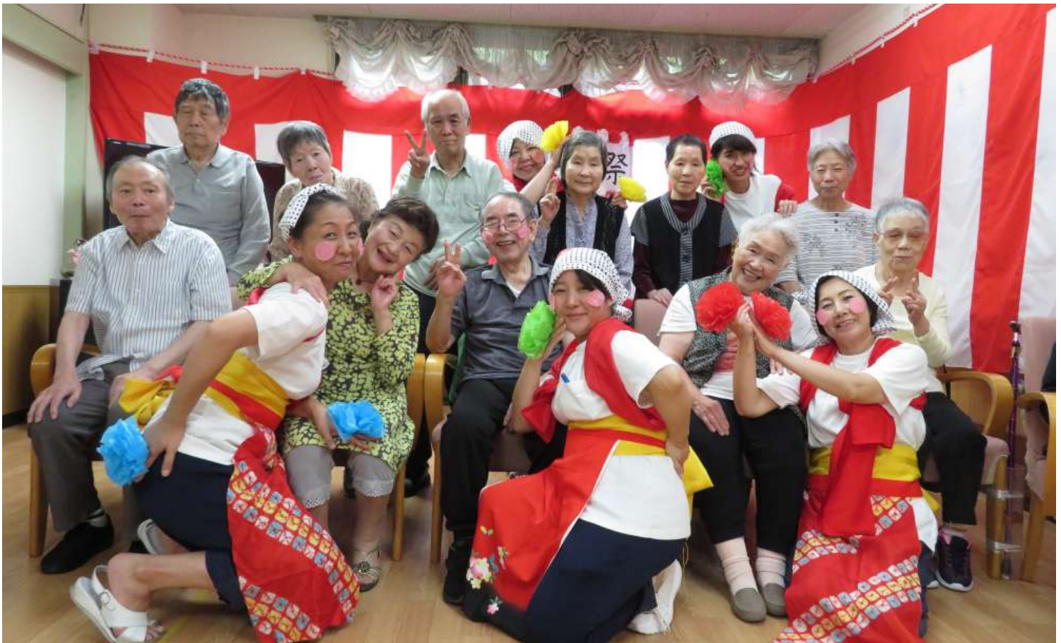
毎年盛大に開催される敬老祭。季節行事は、ご利用者の楽しみの一つとなっています。