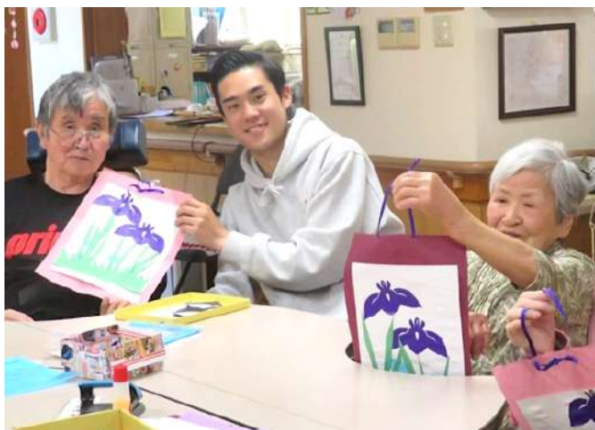
作業活動はいろいろな種類を取り揃えています。