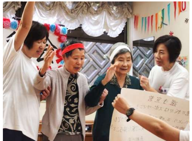
チームで分かれて大運動会を開催！ファイトー