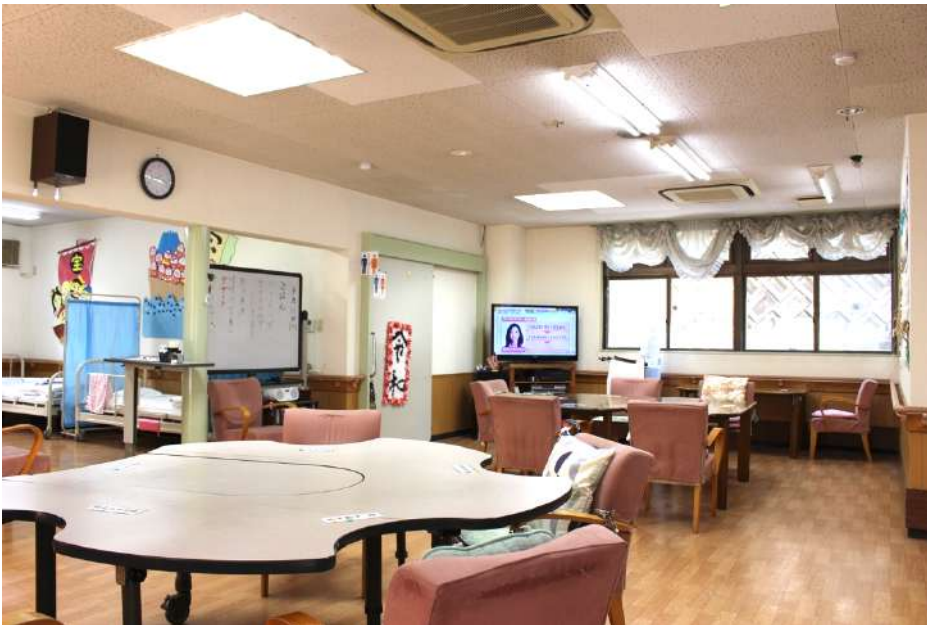
広々としたデイルーム。ベッドルームで休息して頂く事も出来ます。