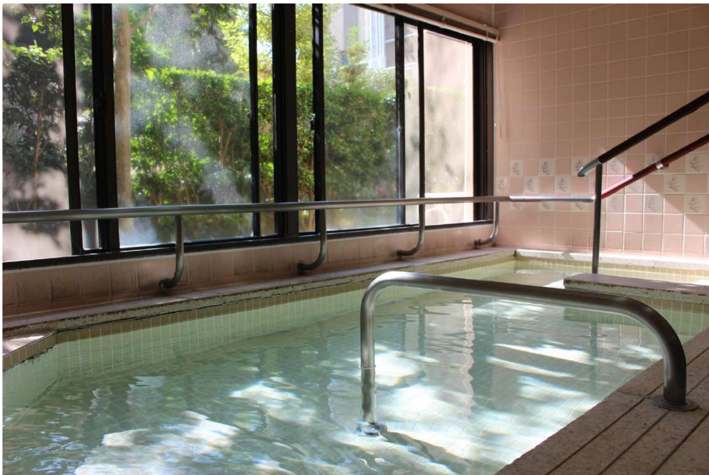
明るい日差しが入る浴室。緑を見ながらゆっくりとご入浴頂けます。