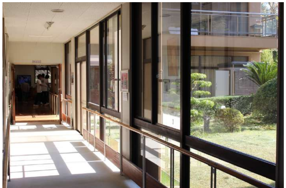
特別養護老人ホーム内1階にデイルームがあります。