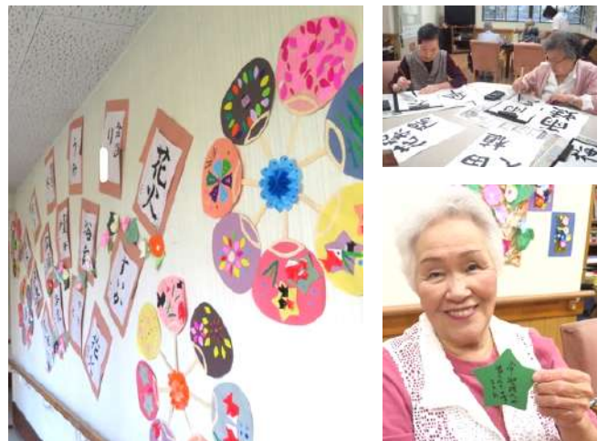
巨大壁画作りや書道の時間もあります。