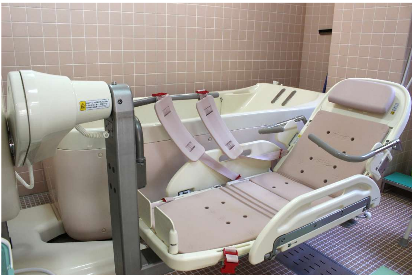
介護が必要な方には、特浴機でご対応させていただきます。安心安全に入浴頂けます。