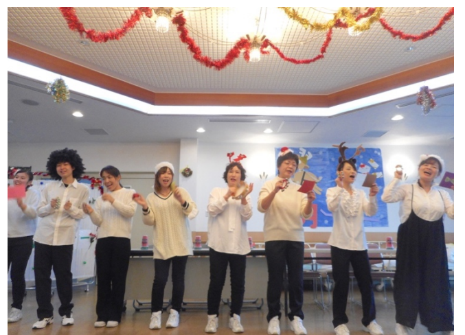
すいすいが一番盛り上がる日！クリスマス会★