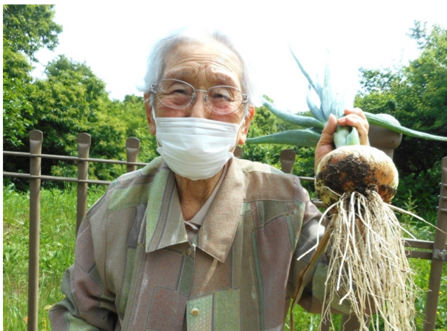
野菜や花を育てる園芸療法を行っています