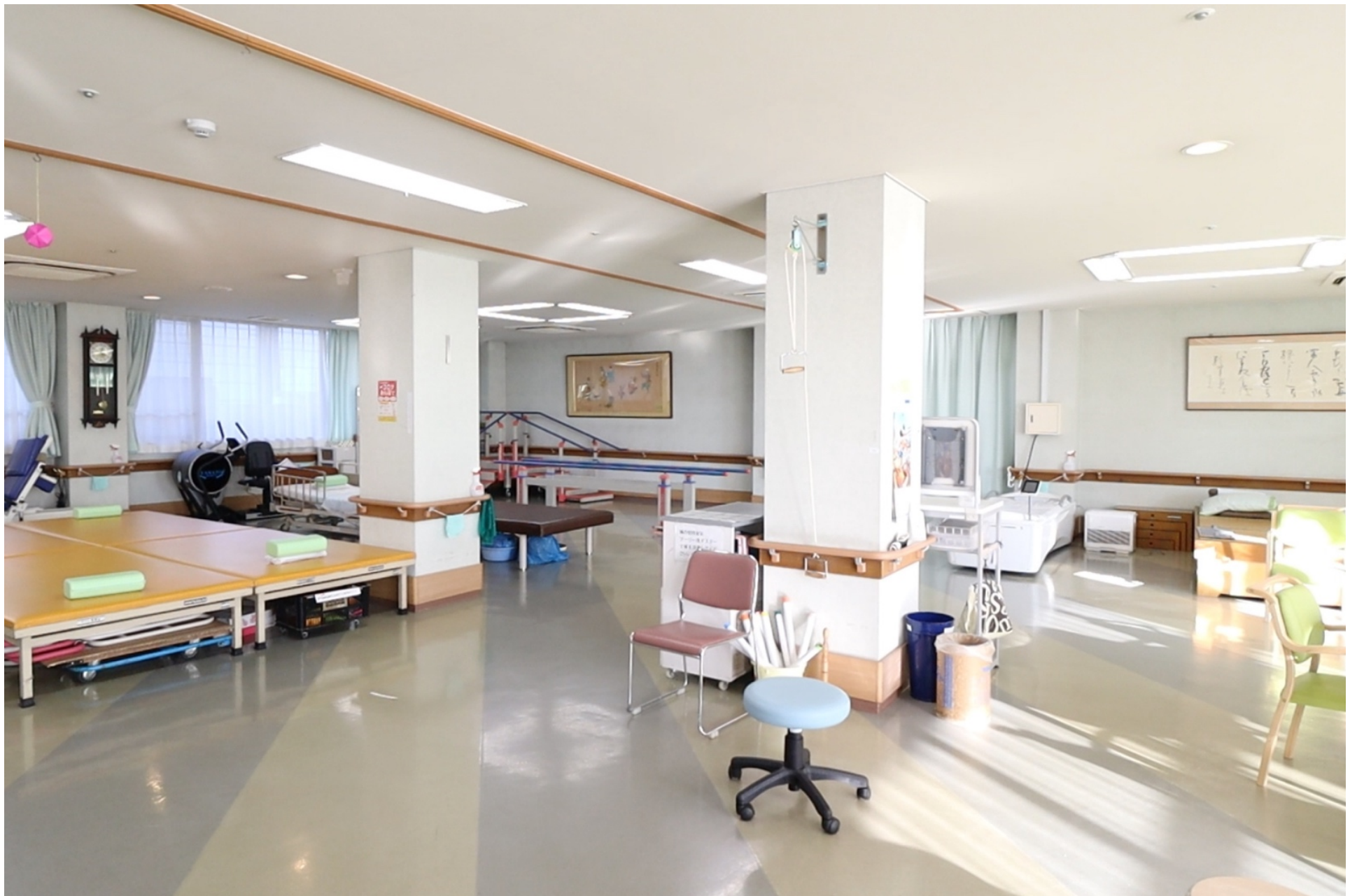
リハビリ室には、トレーニングマシンやウォーターベッドなどがあります