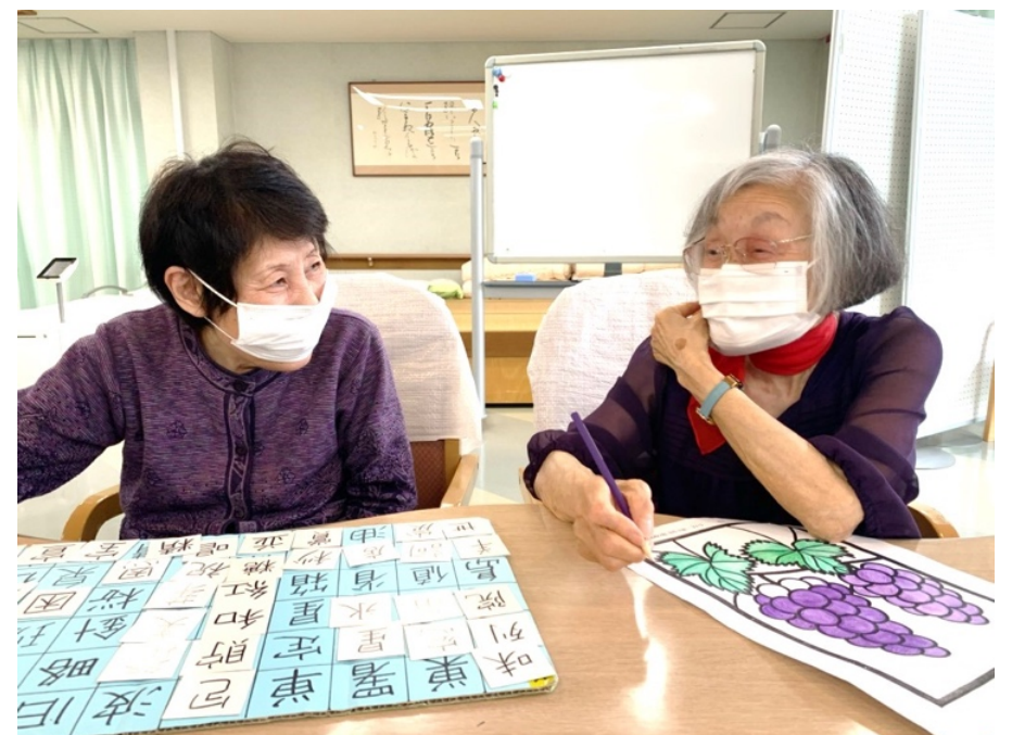
認知症予防の為の作業活動も行っています