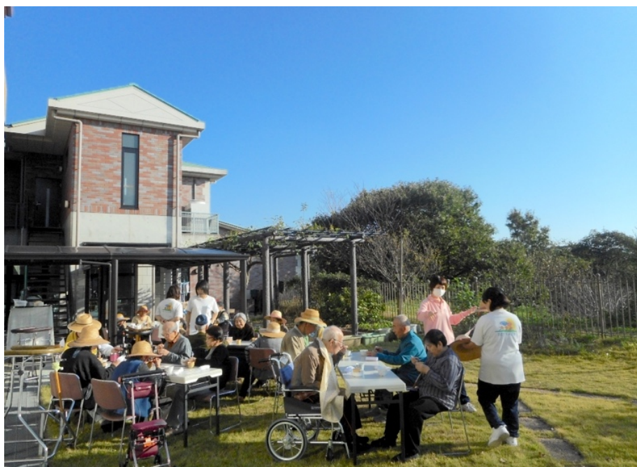
お天気の良い日は、中庭でティータイム♪