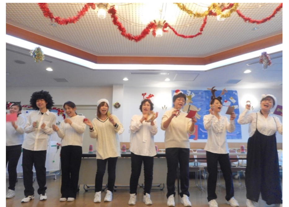
すいすいが一番盛り上がる日！クリスマス会★