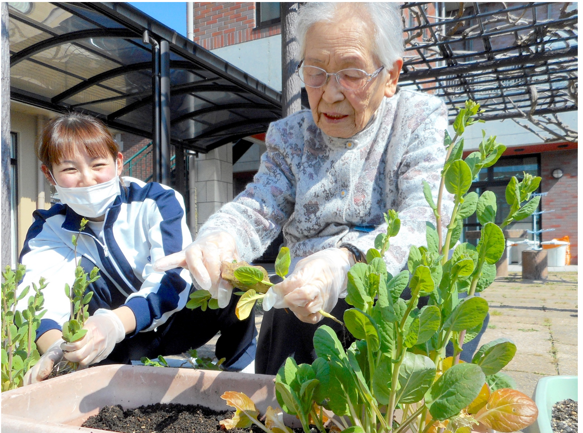
合い言葉は、チャレンジ！！ スタッフと一緒に野菜づくりに挑戦！