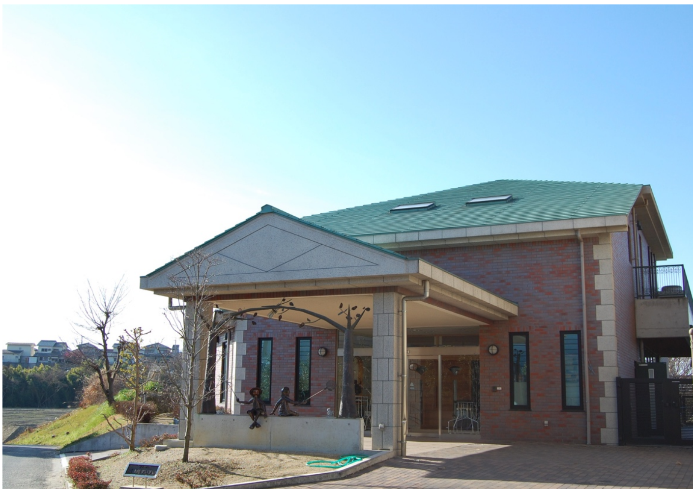
清華苑すいすい 施設外観