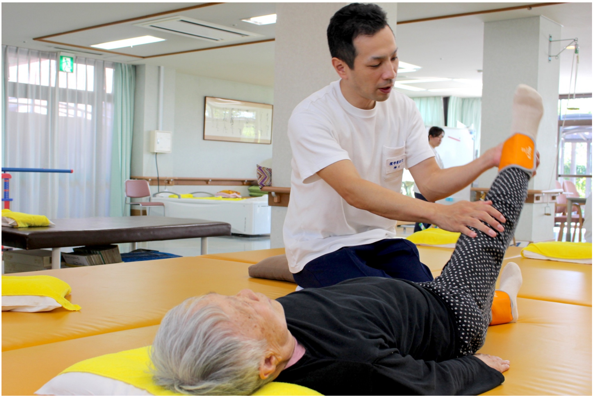
広々としたリハビリ室でゆっくりと訓練を行う事ができます