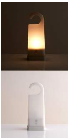
LED 持ち運べるあかり ACアダプター付属 充電式 6,890円(税込み)