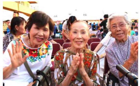
PHOTO ギャラリー 納涼祭

企画や準備に大忙しでしたが、入居者みなさんのたくさん笑顔を見ることが出来て良かったです。みなさん、ほんとうにお疲れ様でした。